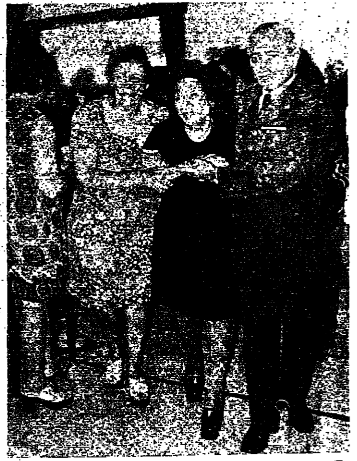
احد الضباط يساعد والدة احدالشهداء في النادي العسكري

وبعد كل ذلك ، ان لاصحاب الجولات ان يبدوا جولة التعقل رحمة بهذا البلد .. وبهم .